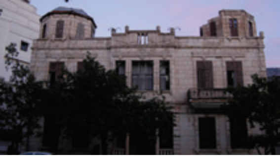
Adalı Konağı (Mado Evi)