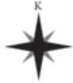
HATAY İL HARİTASI