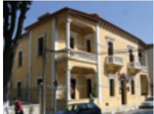
Antik Beyazıt Oteli