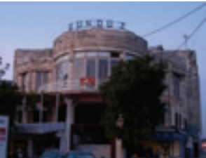
Hatay Eski Meclis Binası